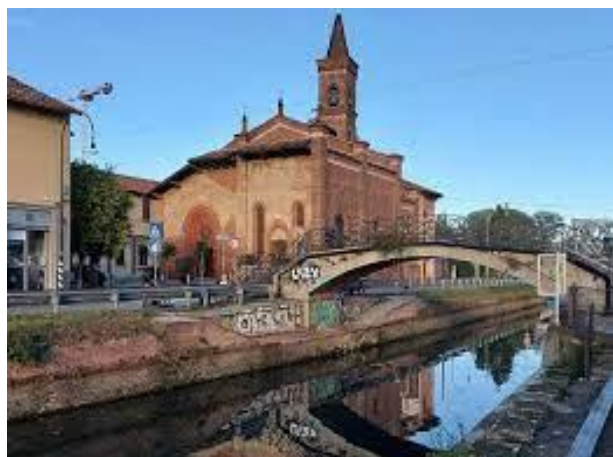
Una suggestiva immagine della chiesa di San Cristoforo al Naviglio.

Ore 16.30- 17.00 Conclusione dell'iniziativa