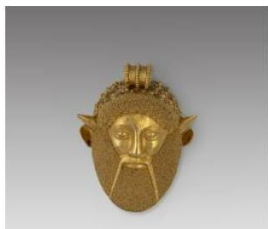
Pendente con testa di Acheloo, Manifattura Castellani metà del XIX secolo e fibula in stile etrusco