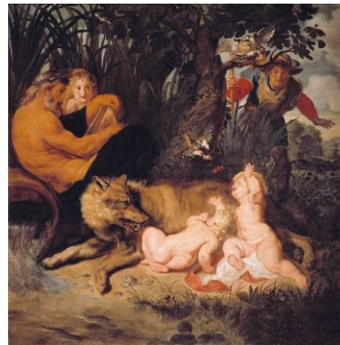
Romolo e Remo allattati dalla lupa.

"Rubens risiedette stabilmente a Mantova in quattro periodi: appena arrivato in Italia, tra agosto e ottobre del 1600; tra dicembre 1600 (dopo aver assistito, insieme alla corte gonzaghesca, alle nozze per procura di Maria de' Medici a Firenze) ad agosto dell'anno successivo (quando partì per Roma); dal suo ritorno dall'Urbe, nel luglio del 1602, alla partenza per la missione diplomatica in Spagna, il 5 marzo 1603; dall'inizio del 1604 fino alla fine di novembre dell'anno successivo, quando partì nuovamente per Roma. Seguendo questa cronologia, appare evidente che abbia conosciuto de visu Raffaello e Michelangelo solo dopo aver visto Giulio Romano". Raffaella Morselli, curatrice della mostra.