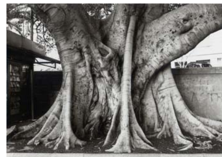
G. Tatge, Ficus Magnolioides, 1999