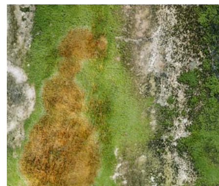
G. Tatge, Muschio, 2014, particolare

In collaborazione con Servizio Cultura e Tradizioni del Comune di Pistoia