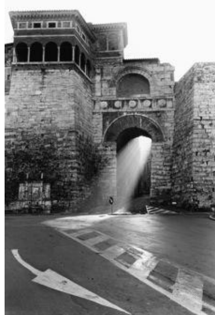
G. Tatge, Porta etrusca, 1983

Mi ha sempre intrigato il vagare, dovunque io sia, lasciando che sia l'automatismo dello sguardo, innescato dall'inconscio, a guidarmi. Il Caso è uno dei fattori più affascinanti, fondanti e propri della fotografia.