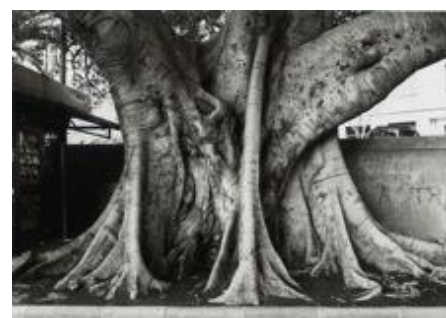
G. Tatge, Ficus Magnolioides, 1999