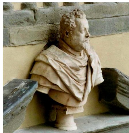
via degli Orafi

Il racconto si chiude rientrando in piazza del Duomo con l'eventuale visita di una sala del Palazzo Comunale. Il percorso ha una lunghezza di circa un chilometro e dura circa un'ora e mezzo, dalle 16,30 alle 18.