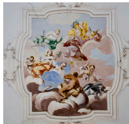
Esterni ed interni di Villa La Màgia