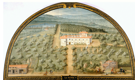
Giusto Utens, Veduta di Villa La Màgia

Villa la Màgia con la circostante tenuta, già antico castellare dei Panciatichi, fu acquistata nel 1583 da Francesco I. La tenuta, che confinava con quelle di Poggio a Caiano, di Artimino, dell'Ambrogiana e di Montevettolini, vantava una posizione particolarmente favorevole in quel sistema di "ville satellite" attorno al Monte Albano dedicate allo svago e alla caccia.