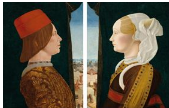
Ercole De' Roberti- Ginevra e Giovanni Bentivoglio