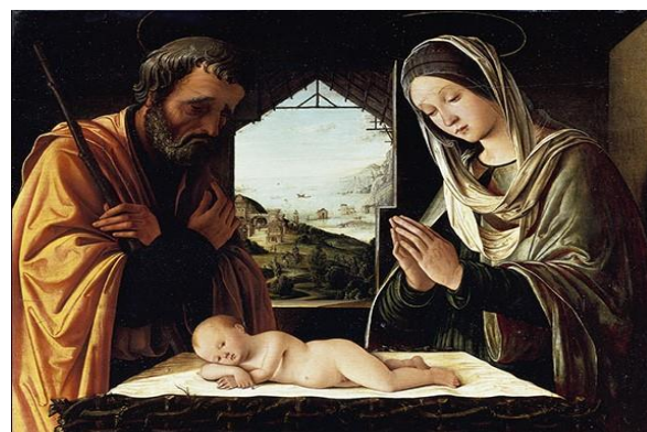
Lorenzo Costa – La Santa Famiglia