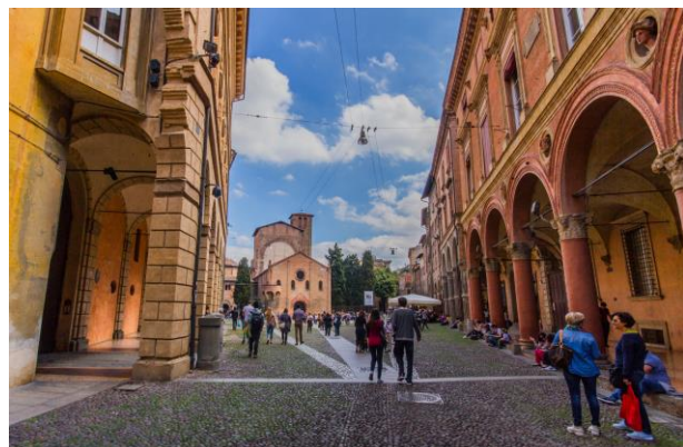
Portici di piazza Santo Stefano